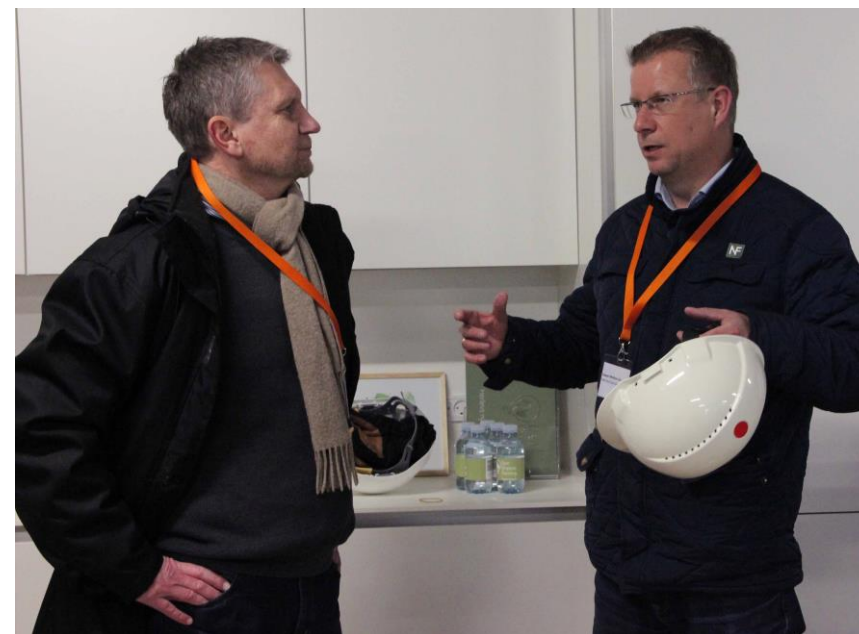
Vi startede i showrommet, hvor der blev snakket og kigget nærmere på plantegningerne over de forskellige lejlighedstyper.